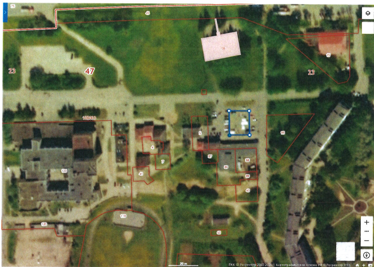
Схема размещения нестационарных объектов. Адрес: Ленинградская область, Гатчинский муниципальный район, Войсковицкое сельское поселение, п. Войсковицы, пл. Манина, 17 (идентификационный номер НТО: 001-3У)